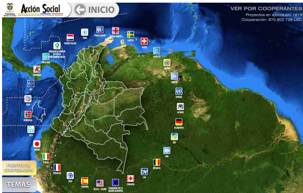
Gráfica 1 Mapa de seguimiento a la Cooperación

La Agencia diseñó un esquema de actualización de la información contenida en este sistema, a través del cual un equipo exclusivo de colaboradores organizados por cooperantes les solicita actualizaciones periódicas de los proyectos a los cuales están destinando recursos. Esta Agencia tiene canales directos de comunicación con las agencias diplomáticas de los Estados Cooperantes que suministran recursos, lo cual facilita la actualización y garantiza un grado de compromiso por parte de los cooperantes.