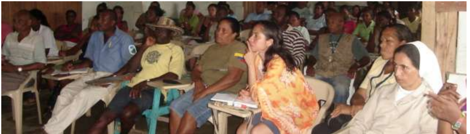
Conversatorio etnoeducación y cultura , Nuquí, 27 de Noviembre.