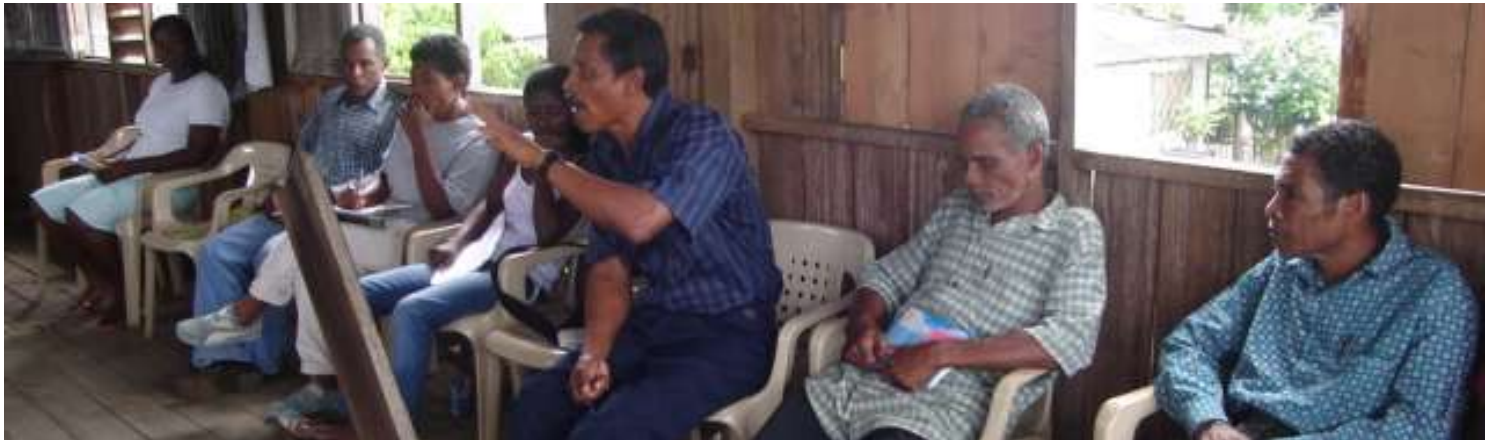
Conversatorio Monte y economía propia , Nuquí.