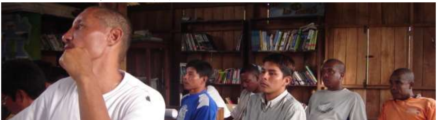
Conversatorio Relaciones interétnicas , Nuquí.