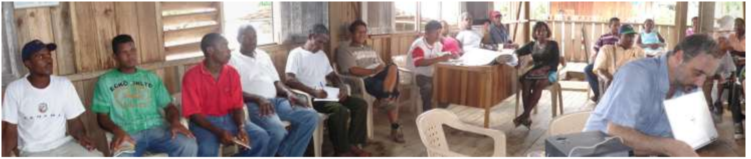
Conversatorio de pesca , Nuquí el del 27 al 29 de Julio.