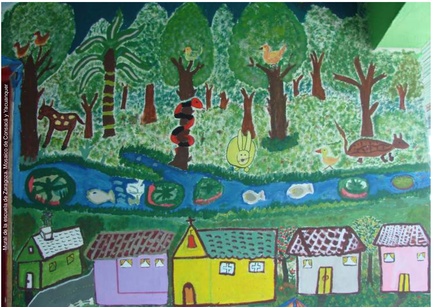
Mural de la escuela de Zaragoza. Mosaico de Consacá y Yacuanquer

MEDIDAS DE USO Y CONSERVACIÓN PARA CAMBIAR EL TERRITORIO DESDE LAS DECISIONES DE LAS PERSONAS QUE LO HABITAN