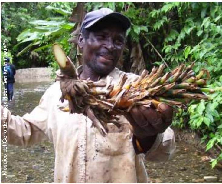
Mosaico del Golfo de Amagá