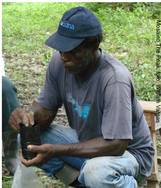
Mosaico The Peak, foto: William Vargas