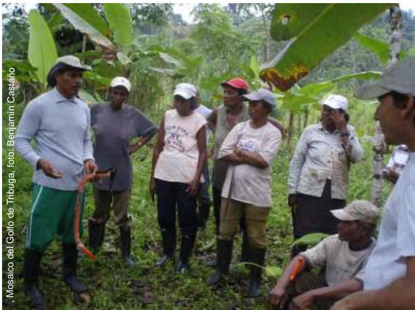
Mosaico del Golfo de Tribuga