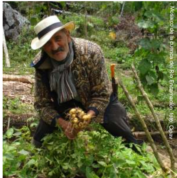
Mosaico de la cuenca del Río Encarnación