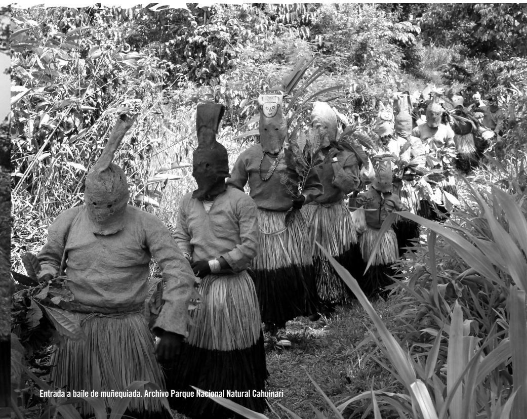
Entrada a baile de muñequiada.