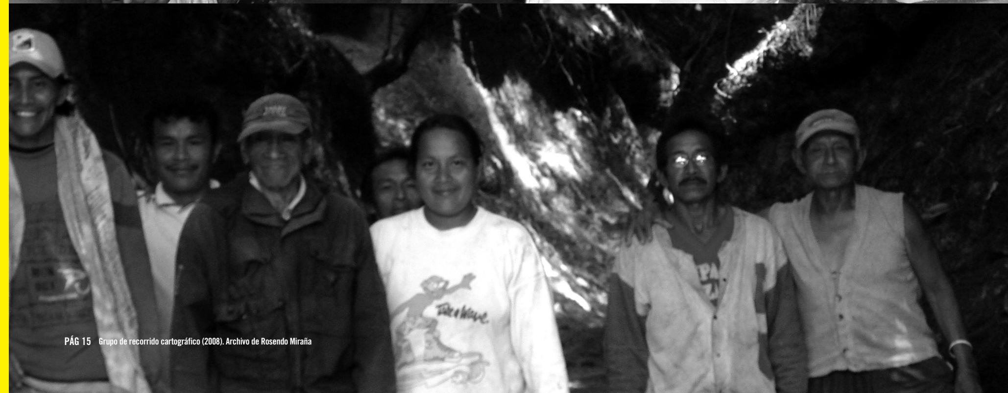
PÁG 15 Grupo de recorrido cartográfico (2008). Archivo de Rosendo Miraña