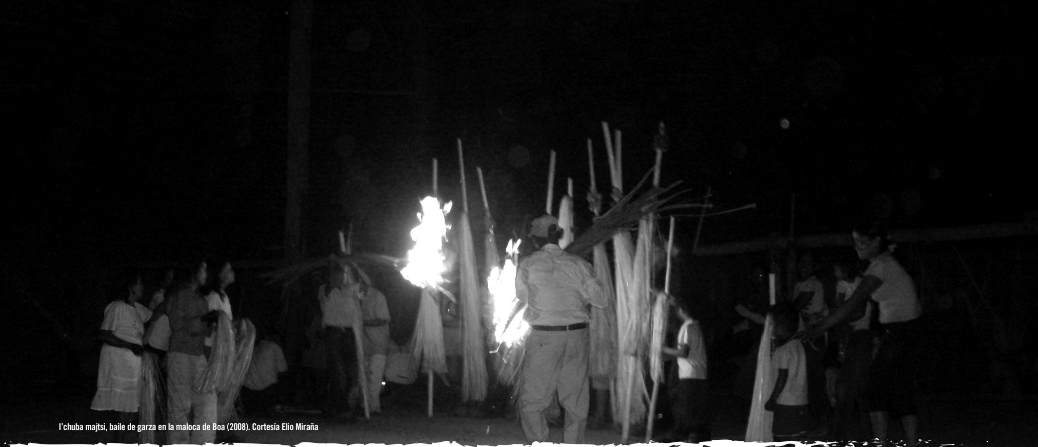
l'chuba majtsi, baile de garza en la maloca de Boa (2008).

Las leyes de origen, del principio siempre han existido en lo espiritual y el pensamiento ha sido el comienzo de una manifestación que se ha vuelto práctica y se ha venido manejando.