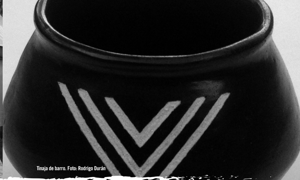
Tinaja de barro.

Las fuentes de empleo dentro del territorio son el Parque Nacional Natural Cahuinarí (11 personas: 4 funcionarios y 7 contratistas), la Secretaría de Salud (3 promotores de salud), los docentes comunitarios (6 en las dos escuelas) o proyectos que busquen dar cumplimiento al plan estratégico de acción del REM. En las comunidades de Puerto Remanso y Mariápolis existen algunas tiendas que son manejadas por mujeres, convirtiéndose en fuentes de trabajo que generan ingresos.