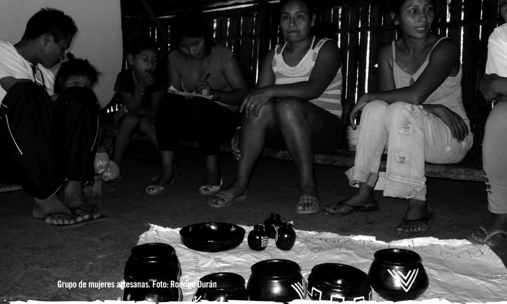
Grupo de mujeres artesanas.