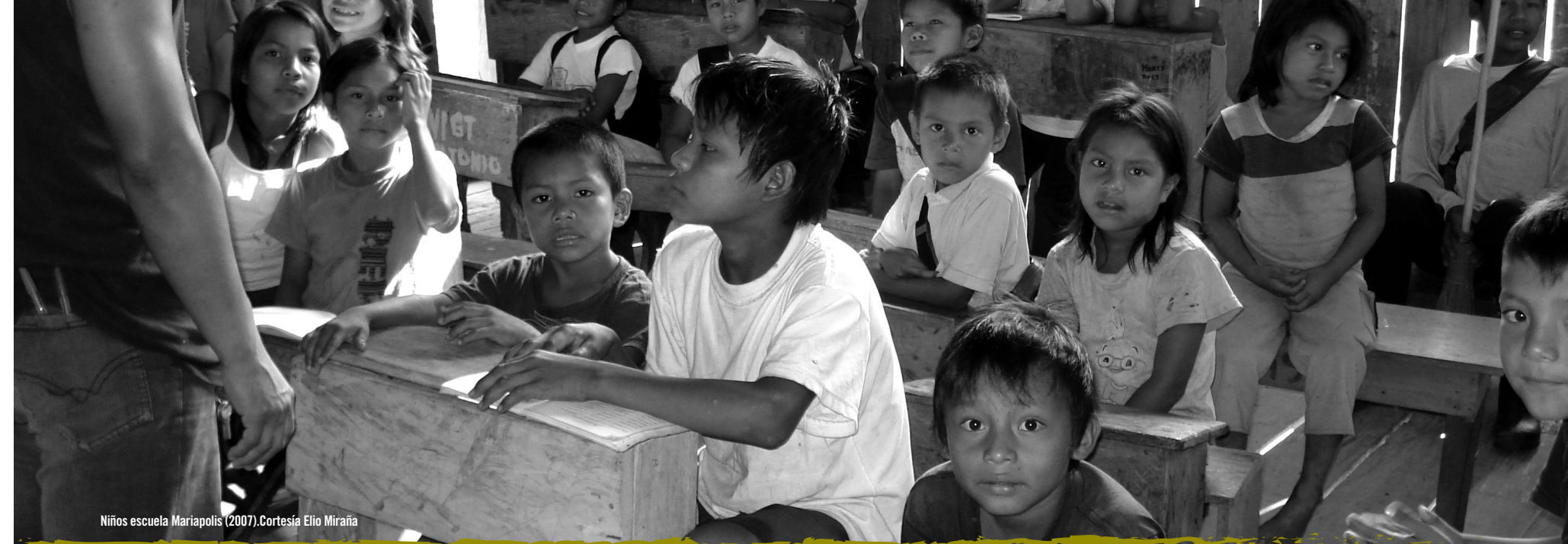
Niños escuela Mariapolis (2007).

Las paredes son construidas con maderas (33,8%) durables y resistentes de árboles como el castaño, aguarrás y laurel (12, 5 y 4 casas respectivamente), entre otros árboles o en ocasiones en yaripa (57,4%) obtenida de palmas como la Zancona, Bombona y el Asaí (17, 9 y 3 casas respectivamente), entre otras; existe también un 2% de viviendas que no poseen paredes (malocas 5 ), que son construcciones tradicionales utilizadas de los pueblos originarios del territorio que aún se usan. En cuanto a los pisos, estos son construidos también con maderas