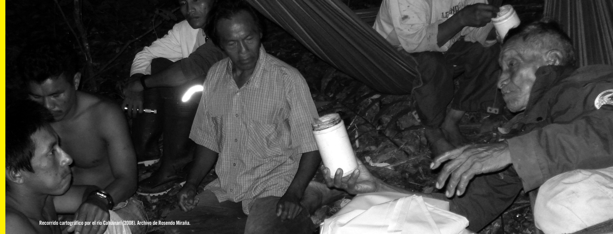
Recorrido cartográfico por el río Cahuinari (2008).