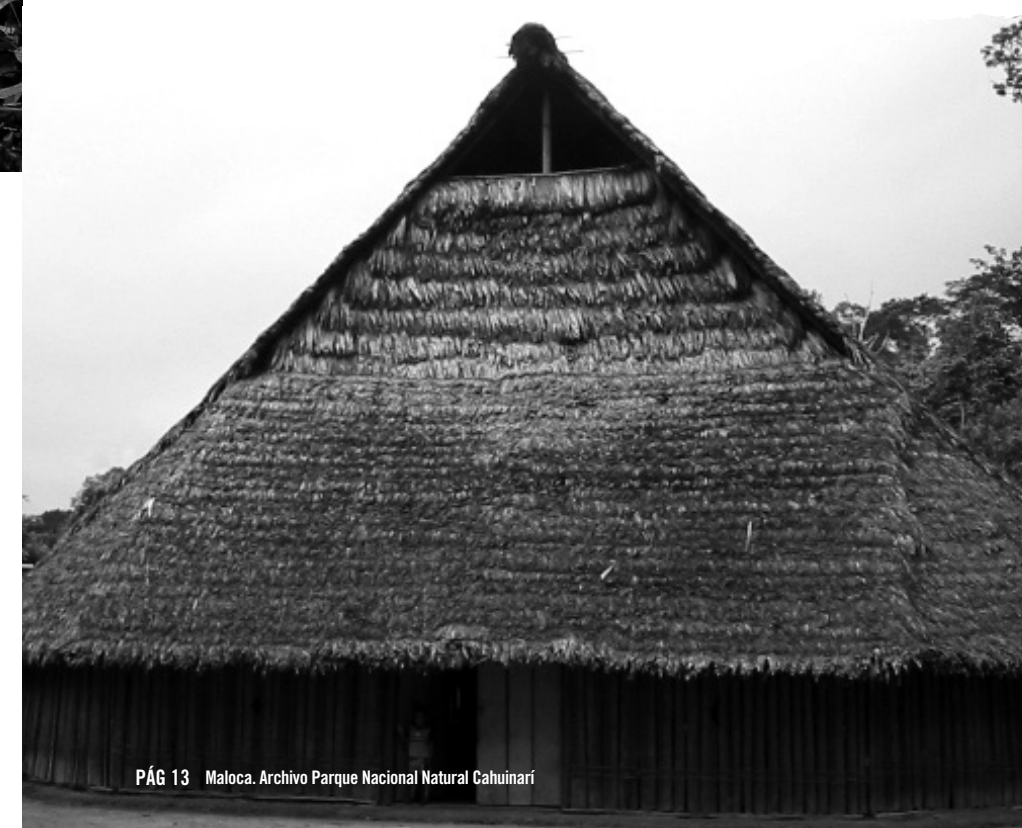
PÁG 13 Maloca.

La creación de los resguardos indígenas Mirití Paraná (1987) y Predio Putumayo (1988), y la del Parque Nacional Natural Cahuinari (1987) son aspectos importantes para la creación del PANÍ.