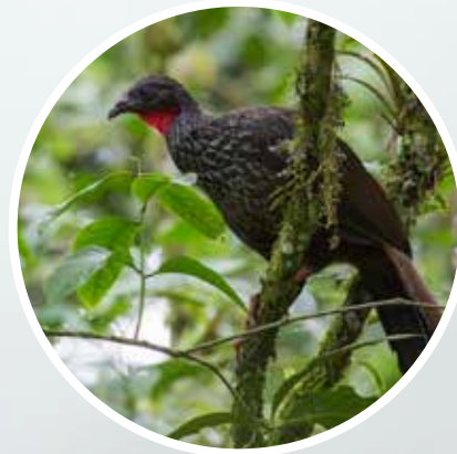
Pava Caucana ( Penelope perspicax ) Endémica, En Peligro (EN).

En una región denominada Corredor de Conservación Paraguas-Munchique ubicada en la cordillera occidental de Colombia.