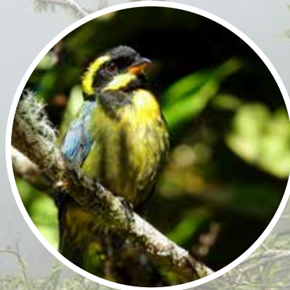
Bangsia de Tatamá ( Bangsia aureocincta ) Endémica, En Peligro (EN).