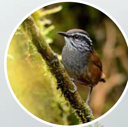
Cucarachero de Munchique ( Henicorhina negreti ) Endémica, En Peligro Crítico (CR).