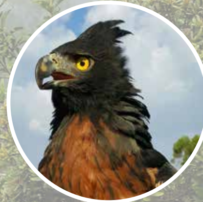
Águila Crestada ( Spizaetus isidori ) En Peligro (EN).